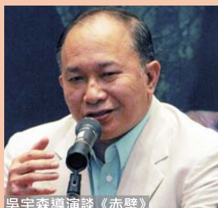
吳宇森導演談《赤壁》