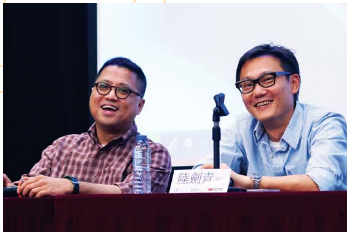
金像獎最佳導演梁樂民先生及陸劍青先生與本學院學生談《寒戰》