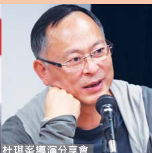
杜琪峯導演分享會