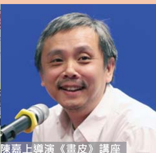
陳嘉上導演《畫皮》講座