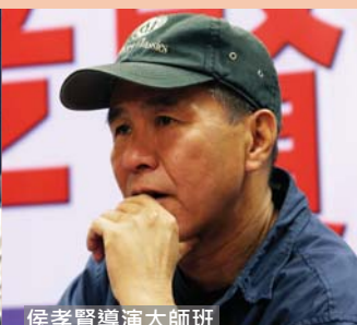
侯孝賢導演大師班